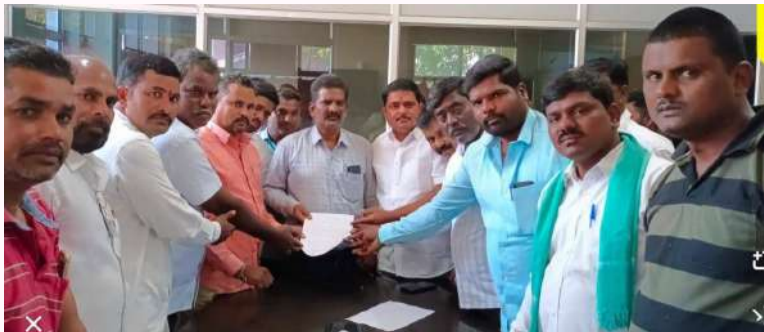
బయోడీసీల్ విషవాయువుని ఆపేయడని వినతి