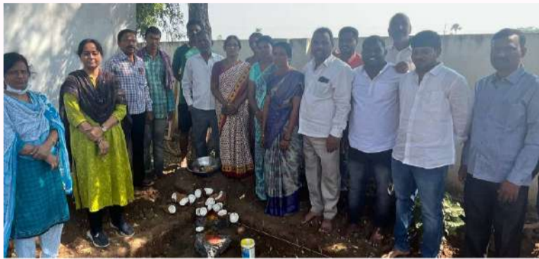
అంగన్ వాడీ భవనానికి శంఖుస్థాపన