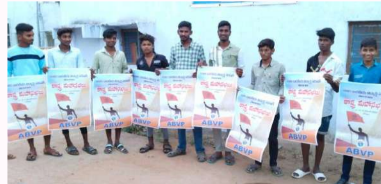
పచివీపీ 41వ రాష్ట్ర మహాసభల గోడపత్రికలు ఆవిష్కరణ