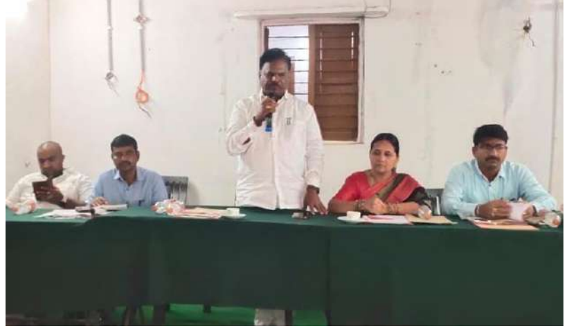
మండల ఎమ్మెల్యే మండల ఎంపీ ఓ , ఏపీవో, ఎంపీటీసీలు సర్పంచ్ లు ప్రభుత్వ అధికారులు పత్రికా మిత్రులు పాల్గొనడం జరిగింది

కడ్రాల్ వార్త మిర్యాల న్యూస్ నవంబర్ 9 : రంగారెడ్డి జిల్లా కల్వకుర్తి నియోజకవర్గం కడ్రల్ మండలంలో సర్వసభ్య సమావేశం నిర్వహించడం జరిగింది ఈ యొక్క సర్వసభ్య సమావేశానికి కల్వకుర్తి ఎమ్మెల్యే జైపాల్ యాదవ్ హాజరు కావడం జరిగింది. ఈ సమావేశంలో మండలానికి సంబంధించిన వివిధ శాఖల అధికారులు అన్ని గ్రామాల సర్పంచులు, ఎంపీటీసీలు ప్రజాప్రతినిధులు హాజరయ్యారు!ఈ సమావేశంలో మండలంకు సంబంధించిన పలు అభివృద్ధి అంశాలపై అభివృద్ధి సమస్యలపై ప్రతి ఒక్క శాఖ నుంచి వచ్చి వివరించడం జరిగింది ఎమ్మెల్యే జైపాల్ యాదవ్ మాట్లాడుతూ మండల స్థాయిలో భవనాల రూపకల్పనకు తెలంగాణ ప్రభుత్వం చర్యలు తీసుకుంటుంది అని ఎమ్మెల్యే జైపాల్ యాదవ్ తెలపడం జరిగింది ఎమ్మెల్యే ఆఫీస్ కి 62 లక్షల ఎమ్మెల్యే జైపాల్ యాదవ్ ఫండ్ నుంచి కేటాయించడం జరిగింది కడ్రాల్ మండలంలో ప్రైవేట్ హెల్త్ సెంటర్ అవసరం ఉంది కోర్ట్ కేస్ కారణం ఉన్నందున నిలిచిపోయింది నేషనల్ 765 4 వే లైన్ ఏర్పాటు చేయడం జరుగుతుంది అని చెప్పారు .ఈ కార్యక్రమంలో ఎంపీడి. రామకృష్ణ జడ్పీటీసీ దశరథ్ నాయక్ వైస్ ఎంపీపీ ఆనంద్ సింగిల్ విండో చెయ్యే గంప వెంకటేశ్ , జెడ్పీ కో ఆఫ్ఫీస్ మేంబర్