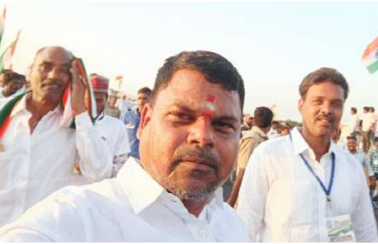
(వార్త మిర్రర్ ప్రత్యేక ప్రతినిధి)