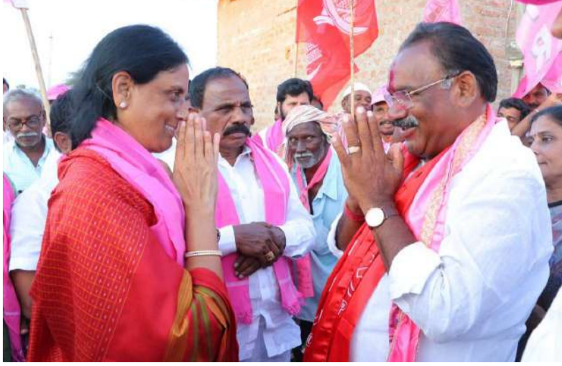
పనిచేసిన పసునూరు, చెల్లవాణి కుంట, నాయక్ తండా ప్రజలందరికీ మంత్రి ధన్యవాదాలు తెలిపారు. మహేశ్వరం నియోజకవర్గ ప్రజాప్రతినిధులు నాయకులు కార్యకర్తలకు మంత్రి సబితా రెడ్డి ధన్యవాదాలు తెలిపారు.