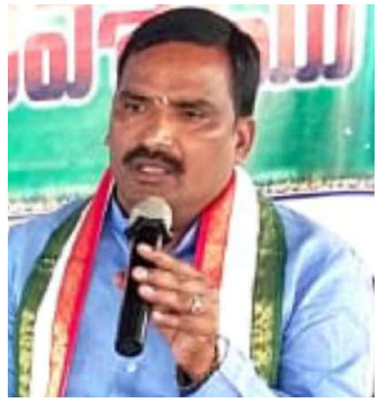
యాదాద్రి వార్త మిర్చి : యాదగిరిగుట్ట మండల విస్తృత స్థాయి సమావేశంలో గుండ్లపల్లి కి చెందిన ముఖ్యుర మజి