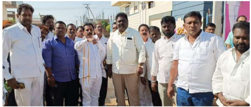
దేవరకొండ నవంబర్ 29 వార్త మిర్రర్ : పట్టణంలో అంతర్గత రోడ్ల నిర్మాణానికి ఆధిక ప్రాధాన్యత ఇవ్వనున్నట్లు దేవరకొండ శాసన సభ్యులు, డిఆర్ఎస్ పార్టీ నల్లండ్ జిల్లా అధ్యక్షులు రమావత్ రమావత్ రవీంద్ర కుమార్ తెలిపారు.మంగళవారం దేవరకొండ పట్టణంలోని 9వ వార్డులో రూ.10లక్షలతో చేపడుతున్న సీసీ రోడ్డు పనులను ఎమ్మెల్యే