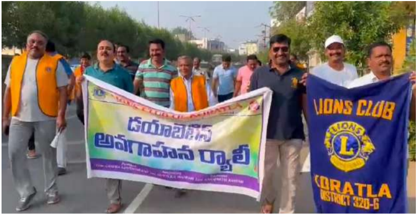
మహమ్మారిని అడ్డుకొని గైకొనవలసిన నివారణ చర్యలు, వ్యాధికి సంబంధించిన నమగ్ర సమాచారాన్ని తెలియజేస్తూ అవగాహన కార్యక్రమాలను నిర్వహించడమే కాకుండా పట్టణంలోని జనసమ్మర్పం కలిగిన వివిధ కూడలల్లో దయాబెటిస్ డిటెక్ట్ క్యాంపులు నిర్వహిస్తూ ప్రజలను అప్రమత్తం చేస్తుంది లయన్స్ క్లబ్ ఆఫ్ కోరుట్ల. మరియు తదితరులు ఉన్నారు

వార్త మిర్చి కోరుట్ల 14 : ప్రపంచంలోనే అత్యధిక మధుమేహ బాధితులు గల దేశాల్లో చైనా మరియు ఇండియాలు (17.5 శాతం) అగ్రభాగాన ఉన్నాయి. ఇండియాలో 7.7 కోట్ల (చైనాలో 11.6 కోట్లు) ప్రజలు మధుమేహ రుగ్గులతో బాధ పడుతున్నారు. ప్రపంచ జనాభాలో ప్రతి ఆరుగురు మధుమేహ రోగుల్లో ఒకరు భారతీయుడు ఉన్నారు. ఇండియాలో రాబోయే 25 సంవత్సరాల్లో వీరి సంఖ్య 13.4 కోట్లకు చేరుతుందని అంచనా వేస్తున్నారు. గర్బిణి స్త్రీలకు స్వల్పకాలం పాటు మాత్రమే కనిపించే దయాబెటిస్ ను గెస్టీషనల్ దయాబెటిస్ గా పిలుస్తారు. (క్రీస్తుకు పూర్వం 1550లోనే మానవాళికి దయాబెటిస్ పట్ల పరిచయం ఉన్నప్పటికీ, 1850 ప్రాంతంలో బ్రిష్-1,2 రకాలు గుర్తించడం జరిగింది. 1922లోనే ఇస్పానిన్ ను కనుగొన్న శాస్త్రజ్ఞుడు ఫ్రెడరిక్ బాంటింగ్ (చార్లెస్ బెస్ట్ సహకారంతో) జన్మదినం సందర్భంగా 14 నవంబర్న ప్రపంచ దయాబెటిస్ దినాన్ని ప్రపంచ ఆరోగ్య సంస్థ సహకారంతో 1991 నుంచి పాటించుట జరుగుతోంది. దయాబెటిస్ రాకుండా తగు జాగ్రత్తలు తీసుకోవడం మరియు మధుమేహ నియంత్రణకు వ్యాధిగ్రస్తులు పాటించాల్సిన జీవనశైలి పట్ల అందరికీ అవగాహన కల్పించడం జరుగుతున్నది. ఈ సందర్భంగా లయన్స్ క్లబ్ ఇంటర్నేషనల్ పిలుపునందుకొని గత పదమూడు సంవత్సరాలుగా నవంబర్ మాసాన్ని దయాబెటిస్ అవేర్ నెస్ మాసంగా పరిగణిస్తూ మానవ జీవితంలో ఒక భాగంగా ప్రవేశిస్తున్న ఈ మధుమేహ