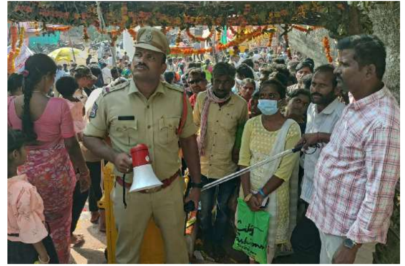
రేగొండ : వార్త మిర్రర్ : మండలంలోని తిరుమలగిరి చివారులో కొలువుదీరిన సుప్రసిద్ధ దేవస్థానం తెలంగాణ తిరుపతిగా పేరుగాంచిన డ్రీ బుగులోని వెంకటేశ్వర స్వామి

ట్రాహ్మాత్సవాలు అంగరంగవైభవంగా జరుగుతున్నవి.చుట్టూ ఎత్తైన కొండలు ఎటు చూసినా పచ్చదనం, చల్లని ఆహ్లాదాన్ని కలిగించే వాతావరణం భక్షజన సంద్రంలో,గోవింద నామస్మరణ నరుమ రమణీయంగా కొనసాగుతున్న వెంకటేశ్వర స్వామి వారిని భక్తులు ఎంతో భక్తపారవశ్యంతో మొక్కులు చెల్లించుకున్నారు.జాతరకు వచ్చిన భక్తులకు సౌకర్యార్థం మునుపేఎన్నడూలేని విధంగా వన్వే (టాఫిక్ ఏర్పాటు చేయడంతో వాహనాల రద్దీ తక్కువయిందని భక్తులు ఆనందం వ్యక్తం చేస్తున్నారు.మొదట గుట్ట కింద ఉన్న పాలగుండంలో స్నానాలు ఆచరించి స్వామివారికి తలనీలాలు సమర్పిస్తున్నారు.అనంతరం రేగొండ పోలీస్ వారి సూచనలను అనుసరిస్తూ కొండపైకి గోవిందా నామ స్మరణ చేసుకుంటూ స్వామివారిని దర్శించుకుంటున్నారు. స్వామివారి దర్శనం అనంతరం గరుడ దీపం వద్ద తమ పాపాలను హరించాలని దీపంలో నూనె వేసి స్వామివారిని వేడుకోవదం అనవాయితీ.