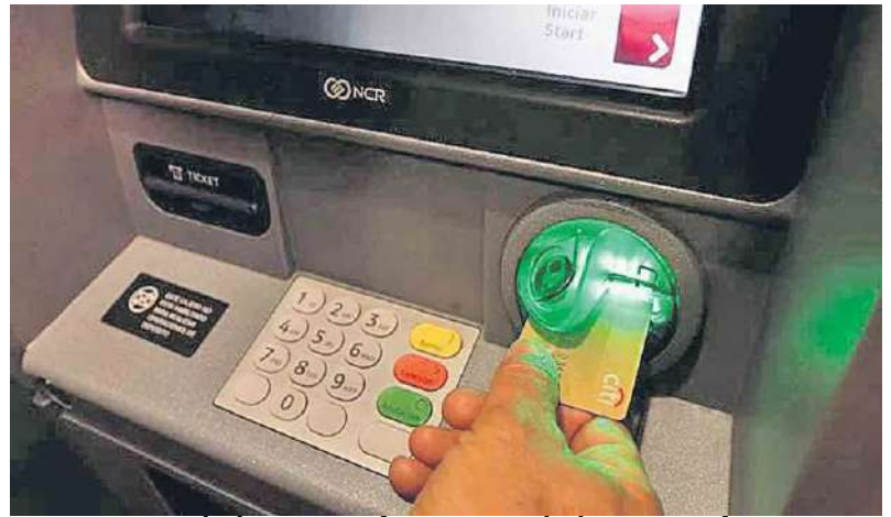
పనులు చేస్తుంది. ఐసీఐసీఐ బ్యాంక్ ఏటీఎంలు, నాన్-ఐసీఐసీఐ బ్యాంక్ ఏటీఎంల్లో సేవలకు ఈ రూల్ వర్తిస్తుంది. యాక్టివ్ బ్యాంకు ఏటీఎంల్లో లావాదేవీలు ఇలా

ఇప్పుడంతా డిజిటల్ పేమెంట్స్ యుగం.. అయినా కొంత మంది బ్యాంకు ఖాతాదారులు ఇప్పటికీ ఏటీఎం ద్వారా ఆర్థిక లావాదేవీలు నిర్వహిస్తూనే ఉన్నారు. ఏటీఎం సేవలు ఉపయోగించుకుంటున్నందుకు ప్రతి ఖాతాదారులూ తమ బ్యాంకుకు చార్జీలు చెల్లించాల్సి ఉంటుంది. ఏటీఎం సేవలు అందిస్తున్న బ్యాంకులు కూడా ఆయా సేవలపై చార్జీలు పెంచేశాయి. దాదాపు అన్ని బ్యాంకుల సొంత ఏటీఎంల్లో ఐదు ట్రాన్సాక్షన్స్ ఫ్రీ. నిర్దిష్ట సంఖ్య దాటిన లావాదేవీలపై బ్యాంకులకు సర్వీస్ చార్జీలు పే చేయాల్సి ఉంటుంది. ఆయా ఖాతాలను బట్టి ఏటీఎం చార్జీలు ఖరారవుతాయి. ఏమీ బ్యాంకులు తమ ఏటీఎంలపై చార్జీలు పెంచాయో ఓ లుక్కొందా.. భారతీయ స్టేట్ బ్యాంక్ (ఎస్బిఐ) ప్రతి రీజియన్ పరిధిలో ఒక నెలలో ఐదు ఉచిత విత్డ్రాయల్స్ ఫ్రీగా కలిపి కలిపి ఉన్నాయి. ముంబై, న్యూఢిల్లీ, చెన్నై, కోల్కతా, బెంగళూరు, హైదరాబాద్ వంటి మెట్రో నగరాల పరిధిలో ఇతర బ్యాంకుల ఏటీఎంల్లో ప్రతి నెలా మూడు ట్రాన్సాక్షన్స్ ఫ్రీగా చేసుకోవచ్చు. ఒక నెలలో సొంత ఏటీఎంల్లో ఐదు కంటే ఎక్కువ లావాదేవీలు జరిగినా, ఇతర బ్యాంకుల ఏటీఎంల్లో మూడు కంటే ఎక్కువ ట్రాన్సాక్షన్స్ జరిపినా ఫీజు పనులు చేస్తుంది ఎస్బిఐ. సొంత ఏటీఎంల్లో ఐదు లావాదేవీలు దాటిన ప్రతి ట్రాన్సాక్షన్ పై రూ.10, ఇతర బ్యాంకుల ఏటీఎంల్లో పరిమితి తర్వాత జరిపే ప్రతి విత్ డ్రాయల్ పై రూ.20 వసూలు చేస్తుంది. సొంత ఏటీఎంల్లో నాన్ పైనాన్సియల్ లావాదేవీపై రూ.5, ఇతర బ్యాంకుల ఏటీఎంల్లో ఆర్థికతర ట్రాన్సాక్షన్ పై రూ.8 వసూలు చేస్తుంది. ఇలా హెచ్చివేసిన బ్యాంక్ ఏటీఎం ఫీజులు