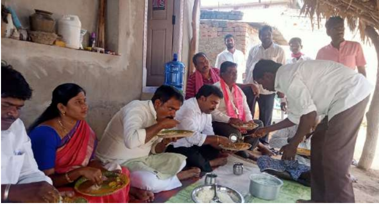
(వార్త మిత్ర ప్రతినిధి)

భోజనాలు వండింది ఒకచోటయితే ... నేతలు భుజించింది మాత్రం దళితవాడలోనా? దళితుల ఓట్ల కోసం టీఆర్ఎస్ నీచ రాజకీయపు ఎత్తుగడలా? దళితులంటే టీఆర్ఎస్ నేతలకంటే చిన్నచూపా?? దళితుల ఇళ్లలో వండిన భోజనం ఎమ్మెల్యే మర్రి ఇతర ప్రజా ప్రతినిధులు భుజించలేరా?? అందుకే వేరొకచోట వండింది, దళిత వాడలో భుజించినట్లు నటనలా?