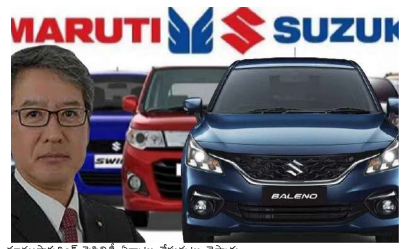
మాన్యుఫాక్చరీంగ్ ఫెసిలిటీ ఏర్పాటు చేస్తున్నట్లు చెప్పారు.

దేశంలోకెల్లా అతిపెద్ద కార్ల తయారీ సంస్థ మారుతి సుజుకి ( %మీపీఐఐఎంఎం% ) మరో రికార్డు సాంఘం చేసుకుంది. దేశంలో కార్ల ఉత్పత్తి మొదలైనప్పటి నుంచి ఇప్పటివరకు 2.5 కోట్ల కార్లను ఉత్పత్తి చేసినట్లు బుధవారం తెలిపింది. 1983 డిసెంబర్ నుంచి హర్యానాలోని గుర్గ్రామ్లో ఉత్పత్తి ప్రారంభించింది. ప్రాదక్షన్ ప్రారంభించిన పుష్కర కాలానికి అంటే 1994 మార్చి నాటికి పది లక్షల కార్లు తయారు చేసింది.2011 మార్చిలో కోటి, 2018 జూలైలో 2 కోట్ల కార్ల ఉత్పత్తి లక్ష్యాన్ని మారుతి సుజుకి అధిగమించింది. హర్యానాలోని గుర్గ్రామ్లో తొలి ప్రాదక్షన్ యూనిట్ ప్రారంభించిన మారుతి సుజుకి.. ఇప్పుడు గుర్గ్రామ్, మనేసార్ యూనిట్ల నుంచి ఏటా 15 లక్షల కార్ల ఉత్పత్తి సామర్థ్యం పెంచుకున్నది.సుమారు 100 దేశాలకు కార్లను ఎగుమతి చేస్తున్నది మారుతి సుజుకి. దేశీయ మార్కెట్లో 16 మోడల్స్ కార్లను విక్రయిస్తున్నది. 'భారతీయలతో 40 ఏండ్ల భాగస్వామ్యానికి 2022 గుర్తుగా నిలుస్తున్నందుకు సంతోషంగా ఉంది. 2.5 కోట్ల కార్ల ఉత్పత్తి.. భారతీయలతో భాగస్వామ్యం, వారి పట్ల తమకు ఉన్న నిబద్ధతకు నిదర్శనం' అని మారుతి సుజుకి మేనేజింగ్ డైరెక్టర్ కం సీఈవో హిషాచి తకైచి పేర్కొన్నారు.ఇక ముందు మార్కెట్లోకి కొత్త మోడల్ కార్లను ప్రవేశపెడతామని హిషాచి తకైచి తెలిపారు. కస్టమర్ల నుంచి తమ కార్లకు ఇదే స్థాయిలో మద్దతు లభిస్తుందని ఆశాభావం వ్యక్తం చేశారు. తాజాగా హర్యానాలోని ఖాన్ఖోడాలో కొత్త