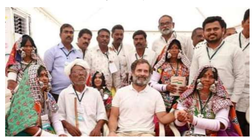
సంస్థాన్ నారాయణపురం. వార్త మిర్రర్ : రాచకొండ పోడు భూములపై సమస్య పరిష్కారం కావాలంటే కాంగ్రెస్ పార్టీ అధికారంలోకి రాగానే సమస్య పరిష్కారం చూపుతానని రాహుల్ గాంధీ రైతులకు హామీ ఇచ్చారు.. తెలంగాణలో రైతులు చేనేత కార్మికులు పడుతున్న కష్టాలను

అధికారంలోకి రాగానే సమస్యకు పరిష్కారం చూపుత: రాహుల్ గాంధీ