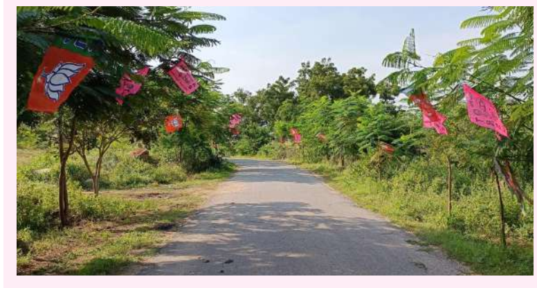
చెట్లకు కాసాయి జెండాలు..

సంస్థాన్ నారాయణపురం. వార్త మిర్రర్ : ఏంటి చెట్లకు జెండాలు కాసాయి అనుకుంటున్నారా కాదండి.ఎన్నికల జోరు ప్రచారాల హూరులో అభ్యర్థులు ఒకరు పోతే ఒకరు ప్రచారం చేస్తూ ఊర్లోకి వస్తున్న సమయంలో పార్టీ అభిమానులు చెట్లకు జెండాలను కట్టి ఇలా మైమరిపించారు.