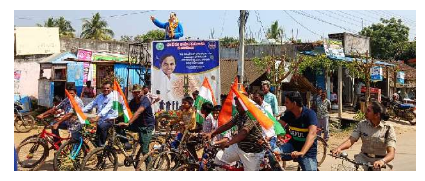
పిలుపునిచ్చారు. చిట్యాల నుండి ఎలేటిరామయ్యపల్లి వరకు సైకిల్ ర్యాలీని నిర్వహించగా.. ఈ

ర్యాలీలో పాల్గొని విజయవంతం చేసిన యువకులకు ఎస్పై కృతజ్ఞతలు తెలిపారు.