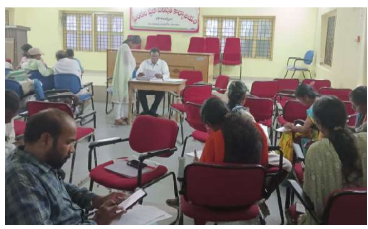
వ్యక్తిగత ప్రయోజనాల కోసమే ఈ సమాచారాన్ని కోరినట్లుగా వ్యవహరించడం తో విస్తు పోవడం పంచాయతీ కార్యదర్శుల వంతు అయ్యింది.

సమాచార హక్కు చట్టాన్ని కొంతమంది తమకు చుట్టంగా మార్చుకుంటున్నారు. సమాచార హక్కు చట్టం కింద ప్రభుత్వ కార్యాలయాలలోని వివరాలను అడుగుతున్న సదరు వ్యక్తులు, వివరాలను అధికారులు సకాలంలో అందజేయకపోతే, వారిని బ్లాక్ మెయిల్ చేయడం పరిపాటిగా మారింది. చౌటుప్పల్ మండల పరిధిలోని గ్రామపంచాయతీలకు నల్లగొండకు చెందిన ఒక వ్యక్తి సమాచార హక్కు చట్టం కింద ఆదాయ వ్యయాలు, అభివృద్ధి పనుల కోసం చేసిన ఖర్చు... వివరాలను కోరారు. వివరాలికి వెళ్తే... గత 15 రోజుల క్రితం చౌటుప్పల్ మండలంలోని అన్ని గ్రామ పంచాయతీలకు గ్రామ పంచాయతీల వారిగా పన్నులు వివరాలు, ఇతర ఆదాయ వనరుల గురించి వివరాలు తెలియజేయాలని కోరుతూ సమాచార హక్కు చట్టం దరఖాస్తు చేసుకున్నారు. సమాచార హక్కు చట్టం దరఖాస్తును గ్రామపంచాయతీలకు పోస్టు ద్వారా సదరు వ్యక్తి పంపారు.. ఒకవైపు ఎలక్షన్ కారణంగా మరొకవైపు నేషనల్ పంచాయతీ అవార్డ్ కార్యక్రమాల్లో బీజేపీ ఉన్న పంచాయతీ కార్యదర్శులు, అయినా సదరు వ్యక్తి కోరిన సమాచారం ఇవ్వాలి కనుక... మీరు కోరిన సమాచారం జిరాఫీ ప్రతులకు సుమారు విలువను తెలియజేస్తూ ఆ ఖర్చును భరించాలని ప్రత్యుత్తరం పంపడం పంపారు. ఒకవేళ ఆ మొత్తం చెల్లించని యెడల ఒక తేదీ నిర్ణయించుకొని స్థానిక మండల కార్యాలయంలో రికార్డులు తనిఖీ చేసుకోగలరని తెలియజేశారు.. సమాచారాన్ని కార్యాలయపు పని వేళలో మాత్రమేనని తెలియజేయడం జరుగుతుందని వెల్లడించారు.. తను డబ్బులు చెల్లించలేనని రికార్డులు పరిశీలన చేసుకుంటానని బుధవారం రోజున స్థానిక మండల కార్యాలయానికి చేరుకున్నారు. తను కోరిన సమాచారాన్ని పంచాయతీ కార్యదర్శులు రికార్డులు పరిశీలిస్తూ నాకు గ్రామ పంచాయతీ వారిగా పదివేల రూపాయలు ఇవ్వాలని డిమాండ్ చేశారు. పంచాయతీ కార్యదర్శులను బెదిరిస్తూ సమాచార హక్కు ప్రయోజనాలకు భంగం కలిగిస్తూ తన