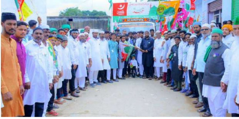
అమనగల్ వార్తా మిర్చి స్యూస్ అక్టోబర్ 9 : రంగారెడ్డి జిల్లా కల్యాణ్ నియోజకవర్గం అమనగల్ మున్సిపాలిటీ పరిధిలో అంగరంగ వైభవంగా ప్రవక్త పుట్టిన రోజు వేడుకలు ఘనంగా మిలాద్ ఉన్ నబి వేడుకలు. శనివారం రాత్రి ప్రత్యేక ప్రార్థనలతో జాగరణ. అమనగల్

మిలాద్ ఉన్ నబి వేడుకలు.. ప్రవక్త పుట్టినరోజు వేడుకలు