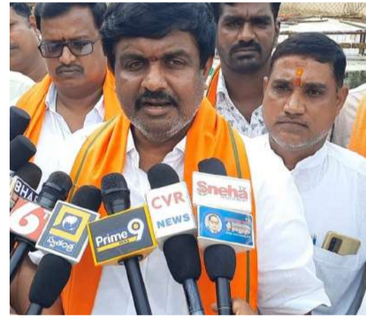
అన్నారు. జిల్లా మంత్రి మునుగోడు నియోజక అభివృద్ధి కి జిల్లా అభివృద్ధికి ఎన్ని నిధులు తెచ్చాడో ప్రజలకు సమాధానం చెప్పాలన్నారు. తెలంగాణ జిల్లాల సమయంలో టి.ఎన్.ఎస్. మంత్రులు ఆస్తులు ఎంత ఇప్పుడు ఎంత