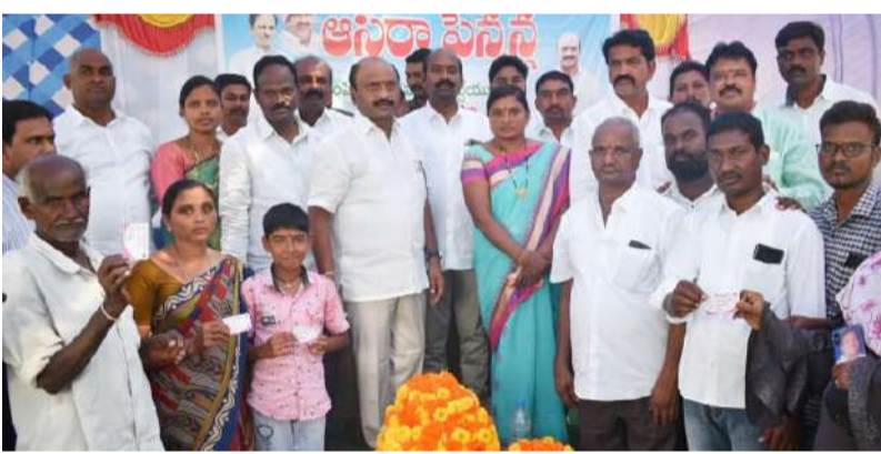
ప్రచారాలు మానుకోవాలని అన్నారు. ఈ కార్యక్రమంలో మండల ముఖ్య నాయకులు, నాయకులు, కార్యకర్తలు, అధికారులు, తదితరులు పాల్గొన్నారు.

పరకాల : వార్త మిర్రర్ : దామెర మండలం ఊరుగోడ గ్రామంలో లబ్ధిదారులకు ఆసరా పెన్షన్లు పరకాల ఎమ్మెల్యే చల్లా ధర్మార్థి పంపిణీ చేశారు. ఈ సందర్భంగా ఎమ్మెల్యే మాట్లాడుతూ, దేశంలో ఎక్కడా లేని విధంగా తెలంగాణ రాష్ట్రంలో 12 వేల కోట్ల రూపాయలను పింఛన్న రూపంలో రాష్ట్ర ప్రభుత్వం పంపిణీ చేస్తుంది. అర్హులైన ప్రతి ఒక్కరికి పింఛన్న ఇస్తామని స్పష్టం చేశారు. వృద్ధావృష్ట పెన్షన్ వయస్సును 65 సంవత్సరాల నుంచి 57 సంవత్సరాలకు కుదిస్తూ రాష్ట్ర ప్రభుత్వం తీసుకున్న నిర్ణయంతో 10 లక్షల మందికి కొత్తగా పెన్షన్లు మంజూరైనట్లు ఎమ్మెల్యే తెలిపారు. ప్రతిపక్షాలు చేస్తున్న కుట్రలను గమనించి గ్రామంలో ప్రజలలో అవగాహన కలిగి విధంగా ప్రతి ఒక్కరూ కృషి చేయాలన్నారు. బిజెపి చేస్తున్న తప్పు ప్రచారాలకు గ్రామాలలో మహిళలు, వృద్ధులు ప్రజలు తగిన రీతిలో బుద్ధి చెప్పాలని కోరారు. బిజెపి నాయకులకు వారి పార్టీ అధికారంలో ఉన్న రాష్ట్రంలో ఏ పథకాలు అమలువుతున్నాయో చెప్పి విధంగా ప్రశ్నించాలి. కేంద్రంలో ఎన్నికల ముందు బిజెపి పార్టీ చేసిన హామీలు నెరవేరుకుండా... అభివృద్ధి చెందుతున్న రాష్ట్రంపై కుట్రలతో చేస్తున్న తప్పుడు