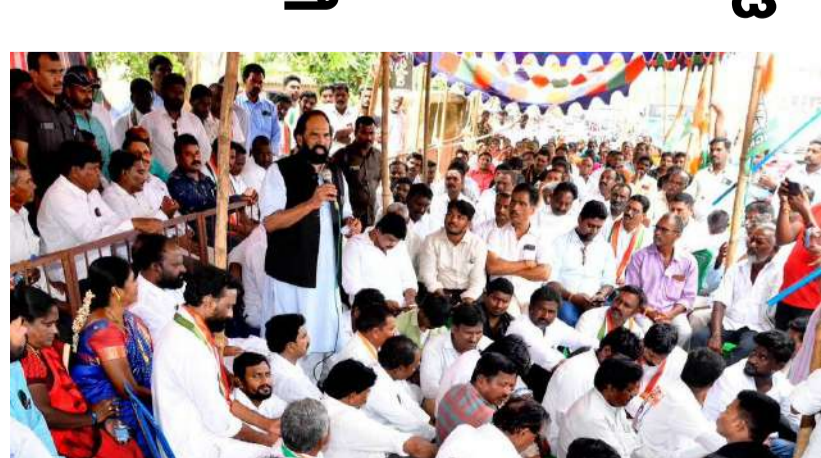
భూములు, భూ దస్తావేజులు షోరికి గురైనాయని, భూకట్టాలకు వ్యతిరేకంగా నిరసన చేపట్టారు. 9 నెలలగా మున్సిపల్ జనరల్ బాడీ సమావేశాన్ని సక్రమంగా నిర్వహించకపోవడం, మున్సిపల్ సర్వే సమావేశాలు లేకుండా పనులను జిల్లా కలెక్టర్ మంజూరు చేయడంపై మున్సిపల్ కౌన్సిలర్లు నిరసన తెలిపారు. ఈ కార్యక్రమంలో మాజూర్ నగర్ నియోజకవర్గ ఏడు మండలాల కాంగ్రెస్ పార్టీ అధ్యక్షులు కాంగ్రెస్ సీనియర్ నాయకులు తదితరులు పాల్గొన్నారు