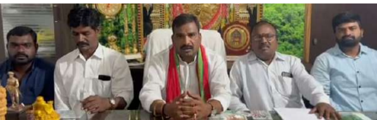
మందిపడ్డారు. యాదగిరిగుట్ట అభివృద్ధి జరిగితే మా బతుకులు మారుతున్నాయనుకున్నాము కానీ ఇలా రోడ్డున పడతాయని అనుకోలేదని అన్నారు. ఇప్పటికైనా యాదాద్రి లో నష్టపోయిన అన్ని కుటుంబాలను అదుకోవాలని సీఎం కేసీఆర్ ను డిమాండ్ చేస్తున్నమని అన్నారు.