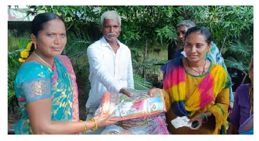
మొత్తం 240 రకాల అంచులతో చీరలు తయారు చేశారన్నారు. 339.73 కోట్ల రూపాయలను ఇందుకు ప్రభుత్వం ఖర్చు చేస్తున్నదన్నారు. దీంతో నేతన్నలకు చేతి నిండా పని దొరుకుతున్నదని చెప్పారు. ఈ నేపథ్యంలో బతుకమ్మ పండుగను అత్యంత వైభంగా నిర్వహించుకోవాలన్నారు.