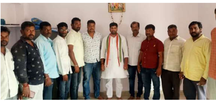
వార్డు మిర్రర్, సంస్థాన్ నారాయణపురం : బీసీలక ప్రతి ఒక్క పార్టీ రాజకీయంగా ప్రాధాన్యత కల్పించి రాజ్యాధికారంలో భాగస్వాములను చేయాలని బీసీ రాజ్యాధికార

హనుమకొండ : రాష్ట్రంలో టీఆర్ఎస్ గుండా రాజకీయాలు చేస్తోందని, బీజేపీ కార్యకర్తలపై దాడులకు దిగుతోందని కేంద్రమంత్రి బీఎల్ వర్మ మండిపడ్డారు. ఉత్తరప్రదేశ్ తరహాలో తెలంగాణలోనూ గుండా రాజకీయాలను అంతం చేసి, ప్రజలకు సుపరిపాలన అందజేస్తామని చెప్పారు. "పార్లమెంట్ ప్రవాన్ యోజన"లో భాగంగా వరంగల్ పార్లమెంట్ నియోజకవర్గంలో పర్యటించేందుకు బీఎల్ వర్మ రాష్ట్రానికి వచ్చారు. శుక్రవారం ఓరుగల్లుకు వచ్చిన ఆయనకు బీజేపీ నేతలు ఘన స్వాగతం పలికారు. అనంతరం వడ్డేపల్లి పట్టణ ఆరోగ్య కేంద్రంలో వ్యాక్సినేషన్ సెంటర్?ను బీఎల్ వర్మ పరిశీలించారు. ఆ తర్వాత నక్కలగుట్టలోని హరిత హోటల్?లో మీడియాతో మాట్లాడారు. ఎన్నో హామీలిచ్చి అధికారంలోకి వచ్చిన సీఎం కేసీఆర్.. ఒక్కటన్నా నెరవేర్చకుండా ప్రజలను మోసం చేశారని మండిపడ్డారు. దళితులకు మూడకరాల భూమి, ఇంటికో ఉద్యోగం, పేదలకు ఇండ్లు ఏమయ్యాయని ప్రశ్నించారు. రాష్ట్రంలో పేదల సాంఘిక కలను నిజం చేసేందుకు ప్రధానమంత్రి ఆవాస యోజన కింద కేలెండ్రి నిధులు ఇస్తుంటే.. కేసీఆర్ వాటిని ఇతర పథకాలకు మళ్లిస్తున్నారని ఆరోపించారు. కేంద్రం తెచ్చిన ఆయుష్షాన్?భారత్? పథకంలో చేరకుండా పేదలకు వైద్య సదుపాయాలను దూరం చేస్తున్నారని ఫైర్ అయ్యారు. వచ్చే ఎన్నికల్లో టీఆర్ఎస్ కు ప్రజల తగిన బుద్ధి చెబుతారని, బీజేపీ అధికారంలోకి వస్తుందని ధీమా వ్యక్తం చేశారు.