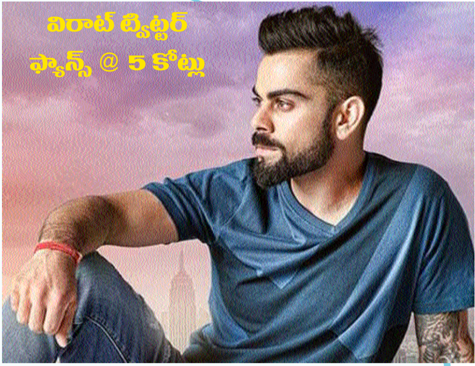
వీరాట్ కోహ్లి ఫ్యాన్స్ @ 5 కోట్లు