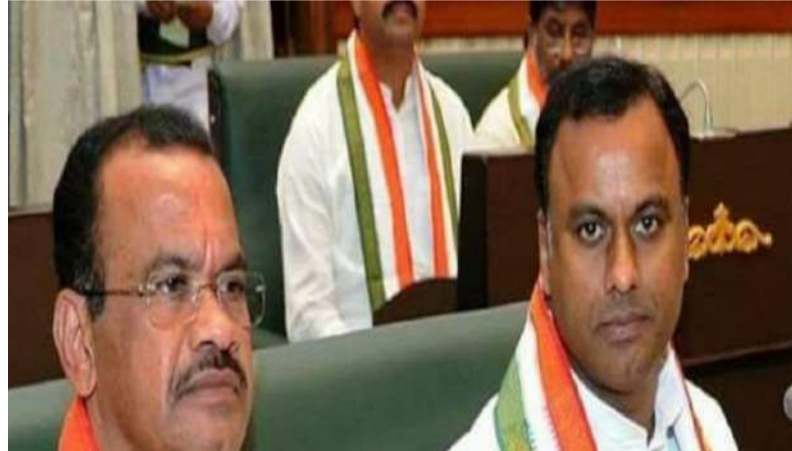
(వార్త మిగ్గర్ ప్రత్యేక ప్రతినిధి)

పోయిన చోట వెతుక్కోవాలన్నది పెద్దది నానుడి. అందుకే ఏ ఉమ్మడి నల్లగొండ జిల్లాలో తన నాయకత్వాన్ని ప్రభుత్వం, ఆ ఉమ్మడి నల్లగొండ జిల్లాలోనే తన రాజకీయ చాణక్యాన్ని టిపిసిసి అధ్యక్షుడు రేవంత్ రెడ్డి ప్రదర్శించాడు? అంటే అవుననే రాజకీయ వర్గాల నుంచి సమాధానం వినిపిస్తుంది. టిపిసిసి అధ్యక్షునిగా పదవీ బాధ్యతలు చేపట్టిన నాటి నుంచి, తనకు మింగుడు పడని కోమటిరెడ్డి సోదరులలో ఒక్కరు ఇప్పటికీ పార్టీకి రాజీనామా చేయగా, ఇక ఎంపీ , పార్టీ స్టార్ క్యాంపెయిన్ల బయటకు పంపేందుకు రేవంత్ వర్గీయులు ప్రయత్నాలు చేస్తున్నారు. కోమటిరెడ్డి సోదరులు పార్టీని వీడినా తమకు నష్టం లేదని భావిస్తున్న రేవంత్ వర్గీయులు, కోమటిరెడ్డి సోదరులందరూ కాంగ్రెస్ ను వీడితే, ఆ స్థానాన్ని