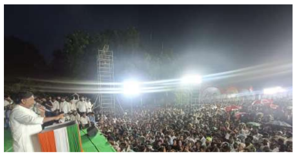
చందూరు, వార్త మిగ్గర్ : కాంగ్రెస్ అభ్యర్థి ఎవరైనా మునుగోడు లో మరొకసారి కాంగ్రెస్ పార్టీ కి ఓట్లని భారీ మెజార్టీ తో గెలిపించాలని మీ అందరినీ కోరుతున్నానని సీఎల్పీ నేత భట్టి విక్రమార్క

అన్నారు. మునుగోడు నియోజకవర్గం చందూరులో ఏర్పాటు చేసిన ఈనాటి ఈ సమావేశం ఒక ప్రత్యేక సమయం లో ఏర్పాటు చేయడం జరిగిందన్న ఆయన , మునుగోడు గద్ద కాంగ్రెస్ అడ్డా అని అన్నారు. ఇక్కడ అనేక పర్యాయాలు కాంగ్రెస్ ని గెలిపించారు. అలాగే మరోసారి కాంగ్రెస్ ని గెలిపించుకోడానికి ఏర్పాటు చేసిన సమావేశం...ఇదని చెప్పారు. మీ అందరి ఉత్సాహం, ఉరకలు చూస్తే ఎన్నికలు ఎప్పుడు వచ్చినా కాంగ్రెస్ సు గెలిపించడానికి మీరు సిద్ధంగా ఉన్నారని, మిమ్మల్ని చూస్తే ఆర్థమైతుందన్నారు. ఆనాడు నిజాం నిరంకుశ పాలనకు వ్యతిరేకంగా నల్లగొండ ప్రజలు పోరాడారని బట్టి విక్రమార్క గుర్తు చేశారు. గత ఎన్నికలలో కాంగ్రెస్ పార్టీ అభ్యర్థిని నిలబెట్టి గెలిపించిన మీ అందరి కోసం మేము ఉన్నాం అని చెప్పడానికి ఇక్కడకు వచ్చామని తెలిపారు.